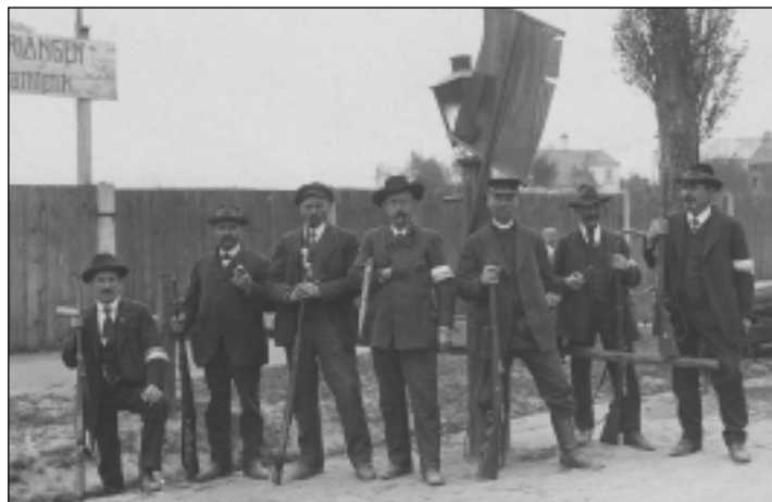
Einwohnerwehr kontrolliert 1919 an der Nürnberger Straße in die Stadt kommende Fahrzeuge.

Vom 5. März bis zum 17. April erinnert eine Ausstellung der Petra-Kelly-Stiftung in der Stadtbücherei an die heute (fast) vergessene revolutionäre Aufbruchstimmung im „Freistaat Bayern“. Fotos, Kurzbiografien, zeitgeschichtliche Dokumente und Quellentexte lassen