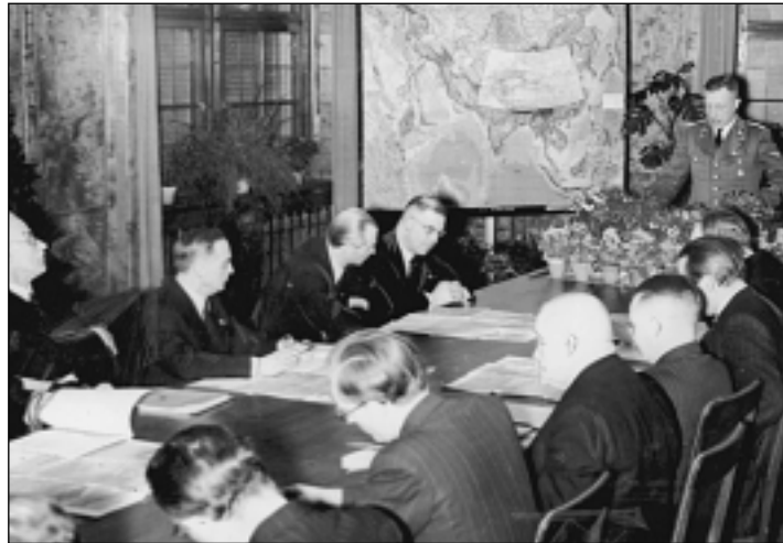
DFG-Präsident Rudolf Mentzel stellt 1941 seinen DFG geförderten Zentralasien-Atlas vor.

förderung sowie die Planungen für eine ethnische Neuordnung Osteuropas während des Zweiten Weltkriegs und werfen dabei einen Blick auf Umsiedlung, Vertreibung und Völkermord zwischen 1939 und 1945.