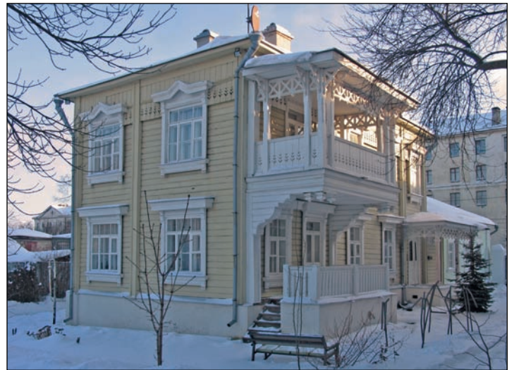
Seit 1995 ist das Erlangen-Haus in Wladimir so etwas wie das Symbol der Partnerschaft

Ich danke für die großartige Gastfreundschaft in Ihrer so liebens-