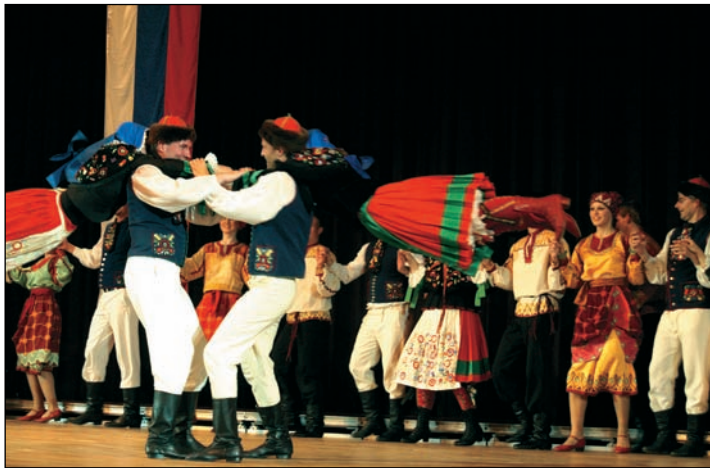
Die Tänzerinnen und Tänzer der Ensembles von Ihna und Wladimirez bei ihrem viel beklatschtem Auftritt während des Festaktes in der Heinrich-Lades-Halle

das Projekt „Blauer Himmel“ informierten.