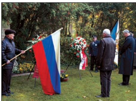
Ehrenbezeugung: Die Oberbürgermeister gedachten auf dem Zentralfriedhof der in den Weltkriegen Gefallenen