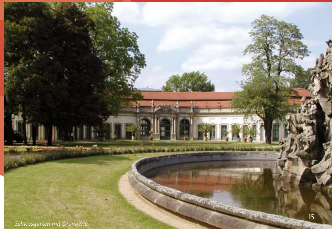
Schlossgarten mit Orangerie