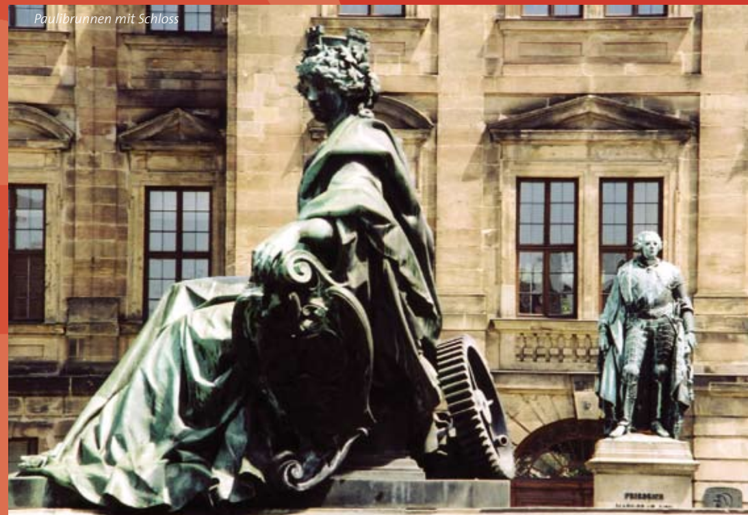
Paulbrunnen mit Schloss

1705 als erster Turm der Neustadt gebaut. Versorgte die markgräflichen Wasserspiele in der Orangerie und im Schlossgarten. Ursprünglich sechsstöckig, die oberen drei