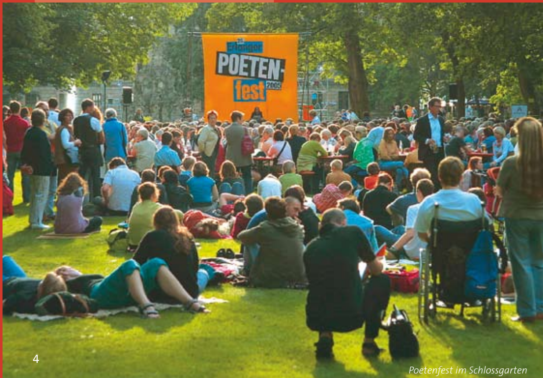
Poetenfest im Schlossgarten