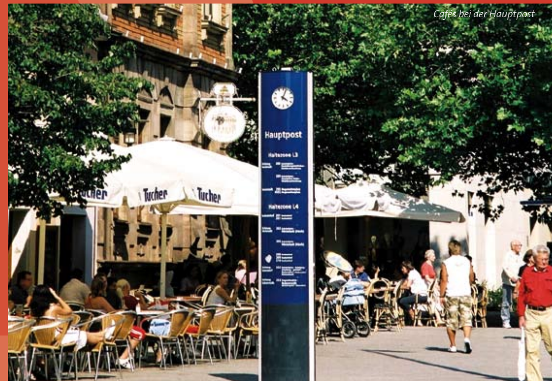
Cafés bei der Hauptpost

als ehemaliges Zentrum der Altstadt, eingefasst von malerischen Barockhäusern, der beschauliche Altstädter Kirchenplatz mit der Dreifaltigkeitskirche, der barocke Schloß- und Markt- platz als Anziehungspunkt für Touristen und Treffpunkt für Einheimische, das Kommen und Gehen am quirligen Hugenottenplatz, dem Ausgangs- und Endpunkt des öffentlichen Nahverkehrs, der Bohlenplatz als grüne Lunge inmitten der City und der Neustädter Kirchenplatz mit seinem mediterranen Flair – der Einkaufsbummel in Erlangen wird zum historischen Rundgang. Parkplätze sind in ausreichender Zahl vorhanden, die City ist bequem zu erreichen. Ein attraktives Bus-Angebot bringt Sie mitten ins Herz der Innenstadt mit ihrer unverwechselbaren Mischung aus Tradition und Moderne.