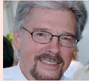
Horst Menapace Intersport Eisert