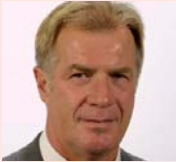
Werner Schmidt Galeria Kaufhof