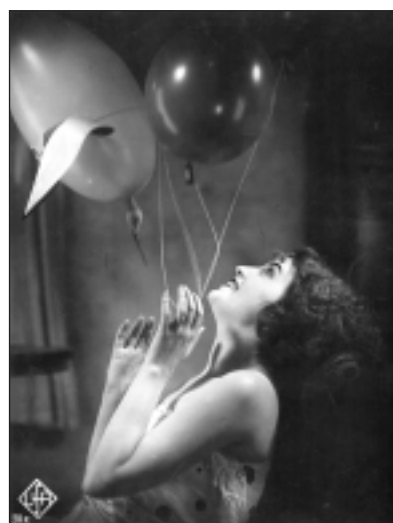
Szene aus dem Stummfilm „Die Carmen von St. Pauli“