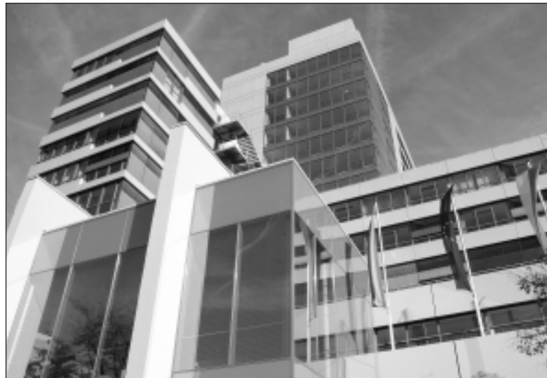
Auf die Haushaltsverantwortlichen im Rathaus kommen wohl schwierige Zeiten zu.

Alle freiwilligen Leistungen auf Prüfstand gestellt - Bis zu 15 Millionen Euro mehr im Stadtsäckel