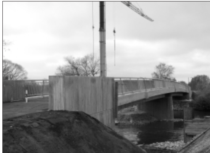
Die Fuß- und Radwegbrücke Wöhrmühle West kurz vor der Fertigstellung.

Für Radler kurze Verbindung von Alterlangen ins Zentrum - 1,3 Mio. Euro Kosten