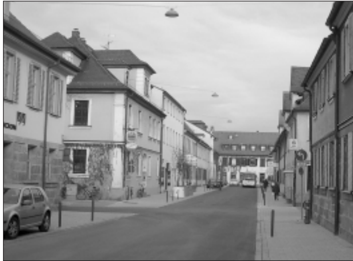
Die nördliche Goethestraße nach Abschluss der Sanierungsarbeiten.

Anstelle Tempo 30 ist in der o.g. Zone nunmehr nur noch Tempo 20 erlaubt. Innerhalb dieses Bereiches gilt generell ein eingeschränktes Halteverbot, auf das nur noch an den Einfahrten hingewiesen wird. Entsprechendes gilt auch für die gekenn-