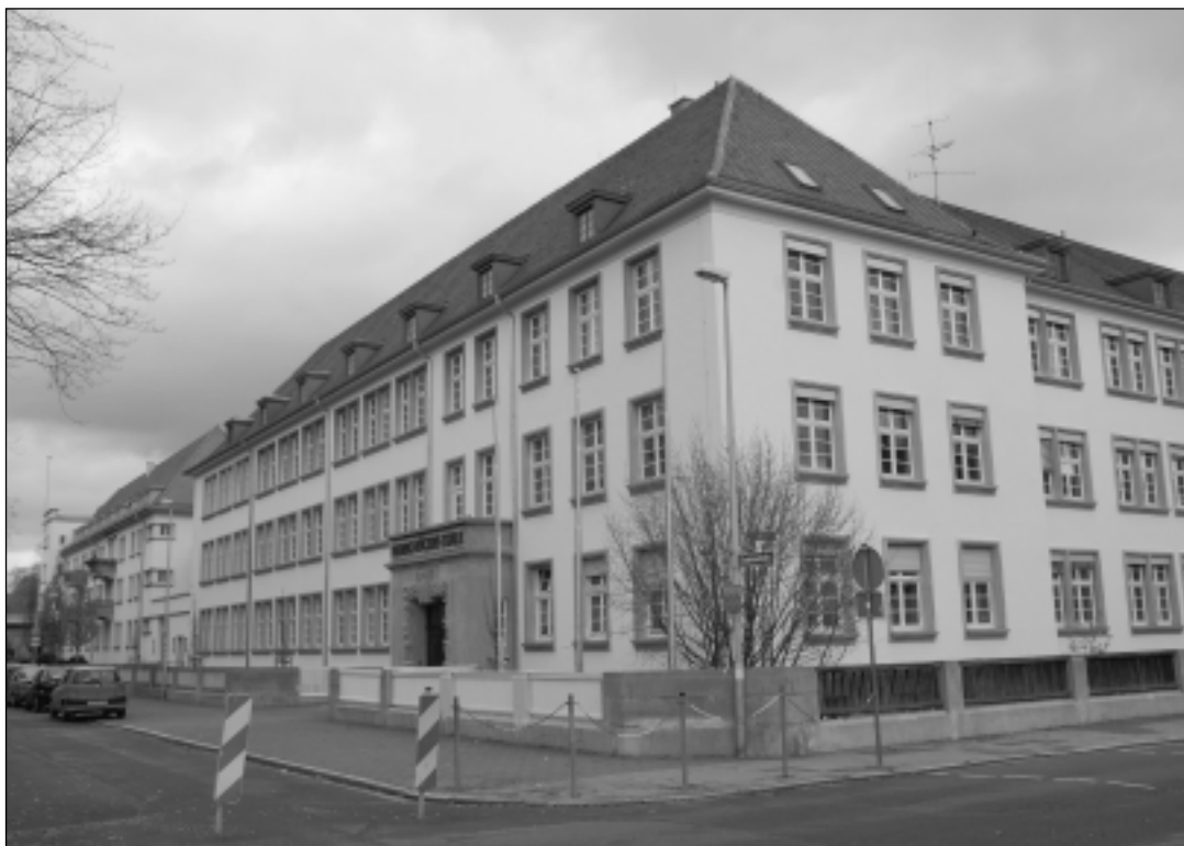
Die Friedrich-Rückert-Schule am Ohmplatz ist wieder ein architektonisches Schmuckstück, nicht nur für Lehrer und Schüler, geworden

halt beschließen, sondern unsere Entscheidung erst im Februar treffen, unterstreicht das die Ernsthaftigkeit der Situation.