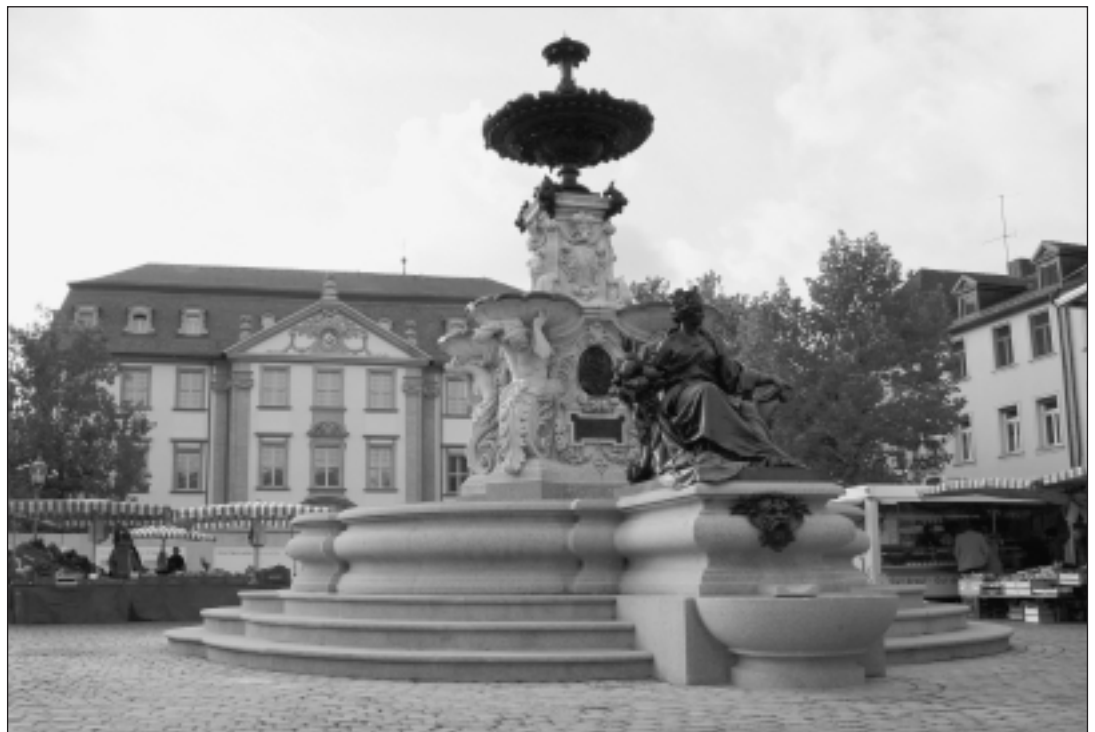
Zwei wie neu glänzende „Perlen“ auf dem Marktplatz: Paulibrunnen und Palais Stutterheim gegenüber dem Schloss

Wir erinnern uns auch der nur kurze Zeit nach ihrem Ausschei-