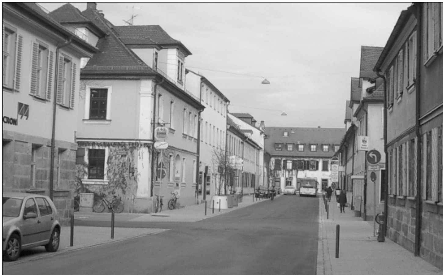
Die Goethestraße nördlich des Bahnhofplatzes nach den umfangreichen Sanierungs- und Neugestaltungsarbeiten, die ein knappes halbes Jahr in Anspruch nahmen

Anregung hin in Zusammenarbeit mit den Amtsleitungen und Referenten Einsparmöglichkeiten geprüft. Sie wird uns im Januar ihre Vorschläge unterbreiten. Ohne diese schon im Detail zu kennen - Das Fazit wird ohne Zwei-