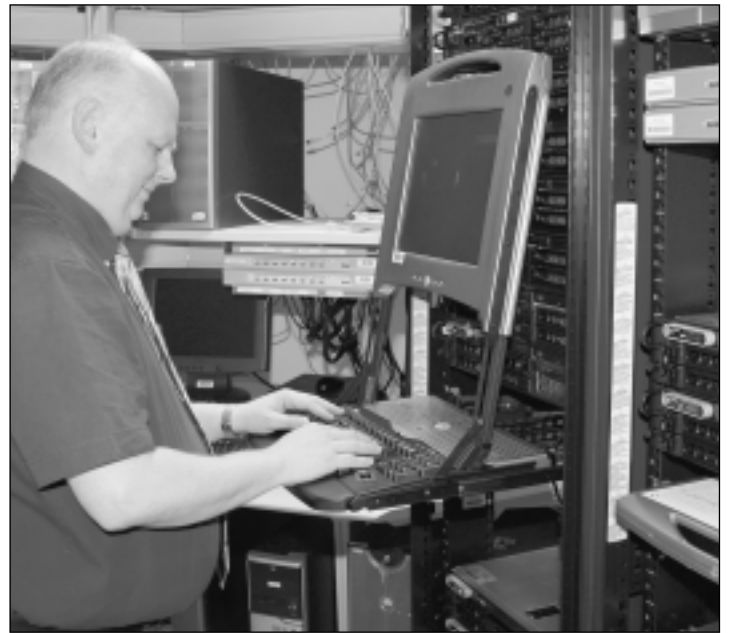
Die städtische Datenverarbeitung wird ab dem Jahr 2010 von Fürth aus koordiniert