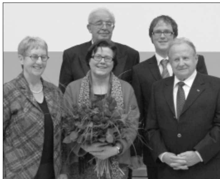
Der amtierende SPD-Fraktionschef (o.t.) mit einigen seiner Vorgänger(innen)

Liebe Mitglieder des Stadtrates, meine sehr verehrten Damen und Herren,