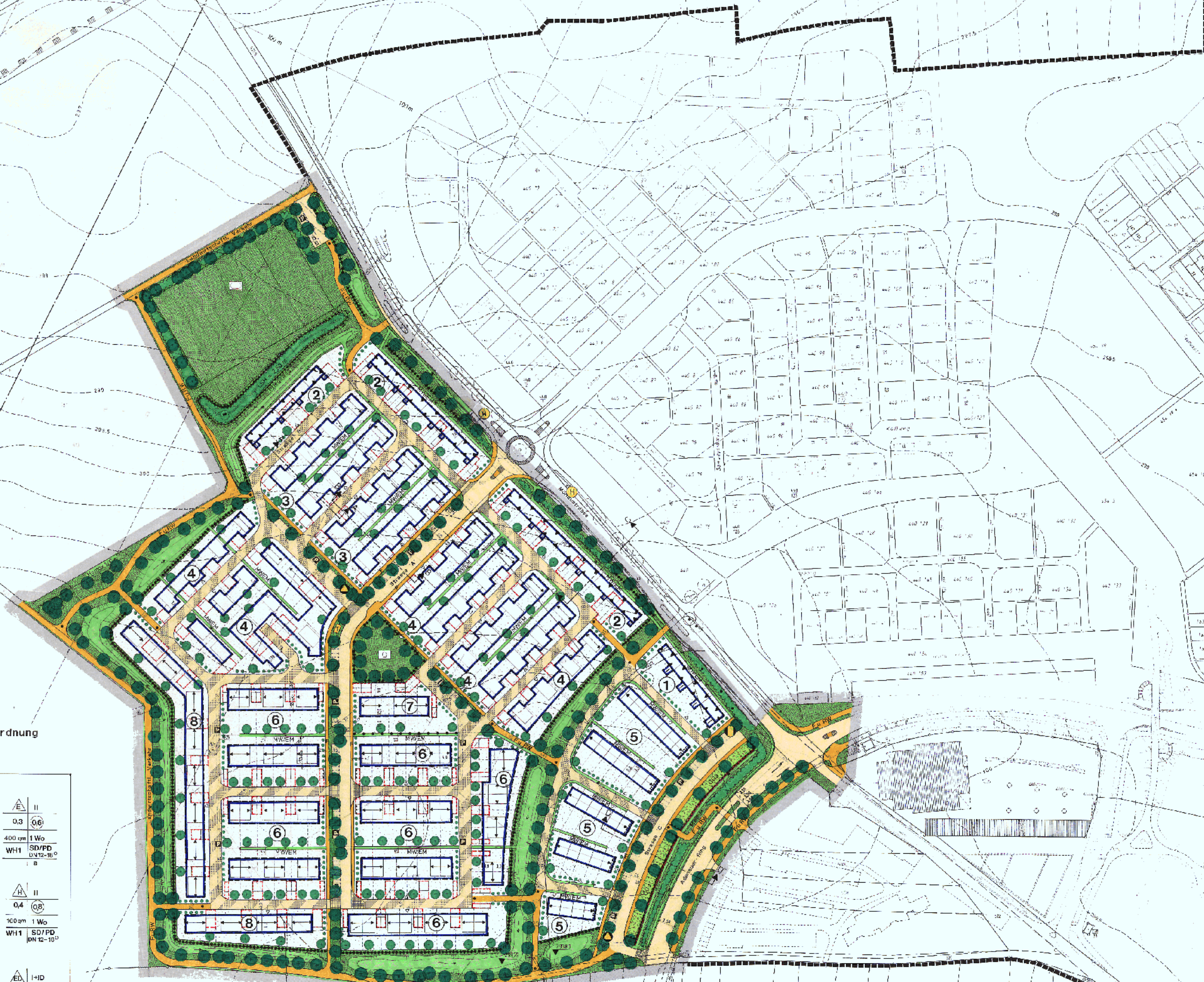
Nutzungsschablonen - Zuordnung