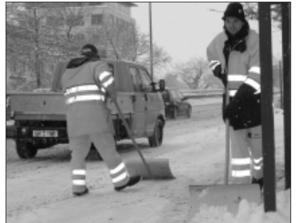
Leisten Schwerstarbeit: Die städtischen Schneeräumtrupps sorgen für sichere Wege und Bushaltestellen.

„Allerdings“, so Winterdienst-Einsatzleiter Wilfried Gruppe, „sind wir personell und materiell an der Leistungsgrenze angelangt“. Um der gewaltigen Schneemassen Herr zu werden, waren in der letzten Woche mit Unterstützung privater Firmen Tonnen der weißen Pracht an einigen großen Kreuzungsbereichen abtransportiert worden, um wieder „Stauraum“ für neue Niederschläge zu schaffen. □