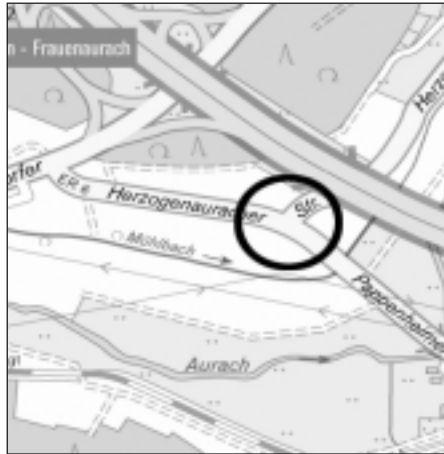
Der neue Kreuzungsbereich, der jetzt etwas südlicher als zuvor liegt (Grafik: Amtliche Stadtkarte).

Mit dem Ausbau der Herzogenauracher und Pappenheimer Straße wurden der gestiegenen Verkehrsbelastung, insbeson-