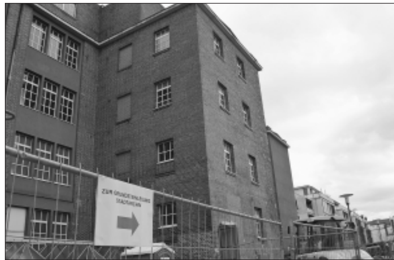
Innen wie außen ein Stück kommunale Geschichte: die künftige Heimat des Stadtarchivs.

OB, Stadtarchivar und Architektin versenkten Kartusche - Fünf Archivstandorte voraussichtlich ab 2011 vereint