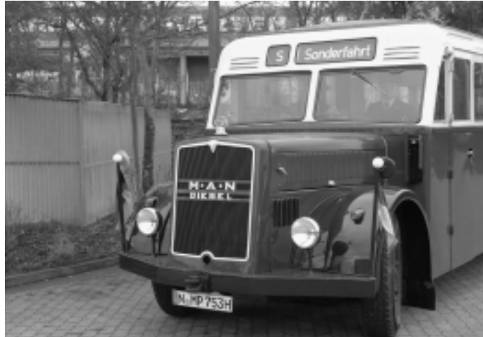
Die Oldtimer lockten viele Erlanger zum Tag der offenen Tür ins Busdepot der ESTW.

Bereits 1894 bemühte man sich um eine direkte motorisierte Verbindung von Erlangen nach Nürnberg. 1912 eröffnete die Post schließlich den Busverkehr zwischen der alten Hauptpost in Erlangen und dem Postamt 2 in Nürnberg. Aber erst 1949 nahm auch der innerstädtische Personennahverkehr seinen Betrieb auf - mit der Linie 90 zwischen der Alterlanger Damaschkestraße und der Buckenhofer Siedlung im Stadtosten. Schon kurze Zeit später fuhr die Linie 70 vom Hugenottenplatz aus über den Zentral-