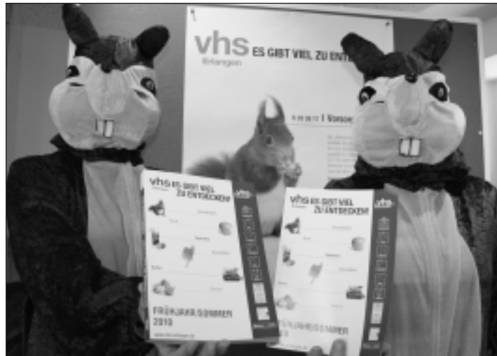
Die Volkshochschule wirbt mit wissensdurstigen Plüschbackenhörnchen.

Sommersemester startet am 1. März mit 1.200 Kursen - 450 Dozenten