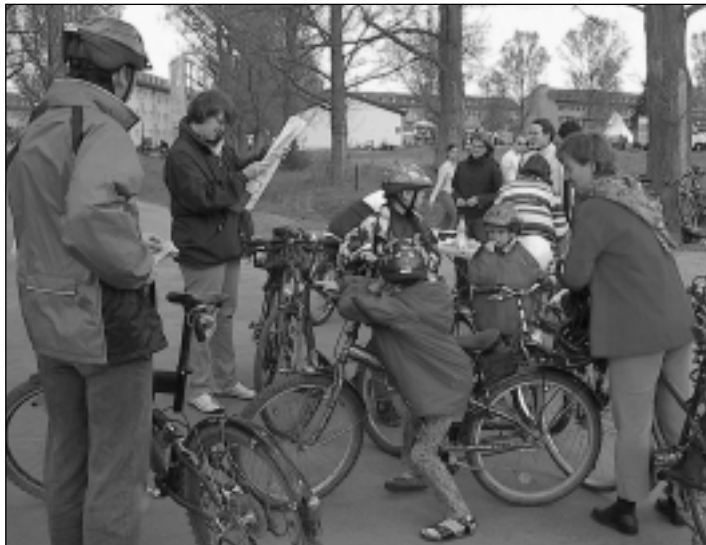
Zieht immer viele Familien an: die Erlanger Rädli.

Erlanger Fahrrad-Rallye findet in diesem Jahr zum 16. Mal statt