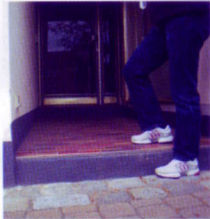
Wie oft laufen Sie über 1-2 Stufen?