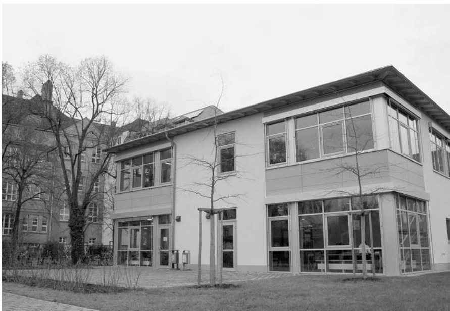
Moderner Anbau am Christian-Ernst-Gymnasium zur Betreuung der G8-Klassen

Die Arbeitsgruppe KomKon (Kommunikation und Konfliktlösung) entwickelte zudem einen Vorschlag für eine Dienstvereinbarung, die Mobbing, Diskriminierung und sexuelle Belästigung am Arbeitsplatz frühzeitig unterbinden soll. Er wird aktuell mit dem Personalrat abgestimmt. Ohne klare Ziele, insbesondere im Zuge der Haushaltsaufstellung, vergeben Politik und Führung die Möglichkeiten, strategisch zu steuern, Prioritäten zu setzen und Qualitäten zu definieren. Ein wichtiges Ziel des Bereichs Zentrale Verwaltung ist deshalb die Entwicklung eines ganzheitlichen strategischen Ma-