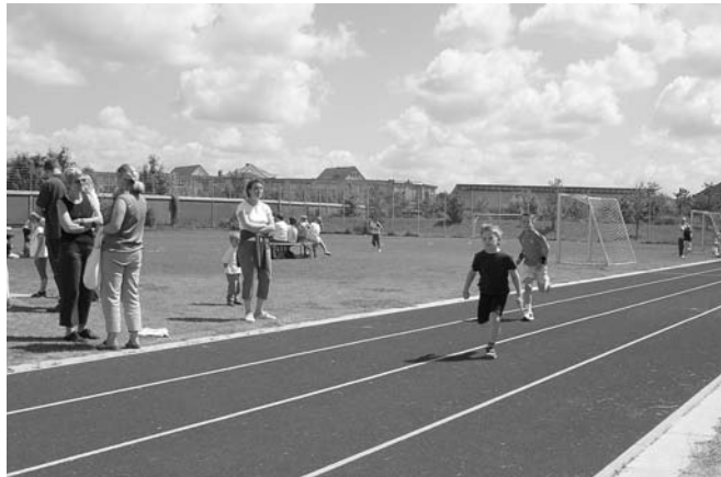
Erlangens Sportjugend trainiert (auch) für Olympia

Nicht ganz so viel öffentliches Interesse fanden Aufgaben wie die Neukonzeption für die Heimunterbringung auswärtiger Schüler der Staatlichen Berufsschule während des Blockunterrichts oder die erstmalige Umsetzung des Büchergelds an insgesamt 33 Erlanger schulischen Einrichtungen.