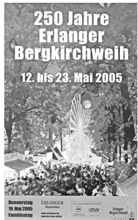
Werbung für Erlangens größtes Fest im Grünen

Vom City-Management und dem Erlanger Tourismus- und Marketing Verein (ETM e.V.), die neue Geschäftsräume am Carrée am Rathausplatz bezogen, wurde ein Hotelleitsystem im Stadtgebiet installiert und die Kundenorientierungsinitiative „Service max“ durchgeführt – neben den wiederkehrenden Veranstaltungen wie z.B. Erlanger Frühling oder Erlanger Herbst – zur Steigerung der Attraktivität unserer Innenstadt.