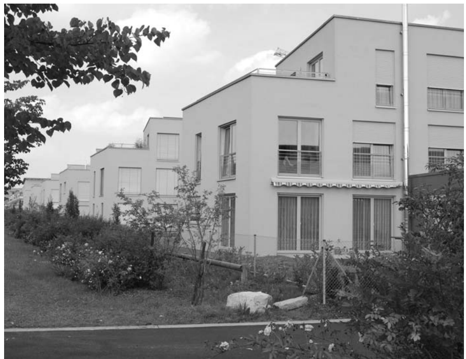
Moderne Stadthäuser am Grünzug im Röthelheimpark

Im Berichtszeitraum wurden insbesondere Baugenehmigungen für Wohnungsbauvorhaben in den Neubaugebieten Büchenbach und Röthelheimpark erteilt, aber auch für größere gewerbliche Bauprojekte wie für die „Erlangen Arcaden“, den Neubau des zweiten Bauabschnitts des Innovations- und Gründerzentrums an der Henkestraße, die Franconian International School und die