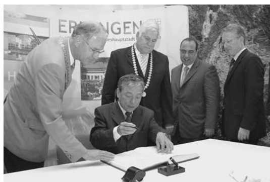
WHO-Generaldirektor Jong-wook Lee beim Eintrag ins Goldene Buch

Das Amt für Informationstechnik steht mit gutem Grund im kommunalen Geschäftsverteilungsplan (vgl. S. 19) ganz vorn: Es schafft die technischen Strukturen, ohne die eine Stadtverwaltung nicht mehr funktionsfähig wäre. Zuletzt betreute das Amt ca. 1.200 PC-Arbeitsplätze, da verstärkt auch Außenstellen und mobile Geräte (Lap-Tops, u.ä.) in das städtische Netzwerk eingebunden