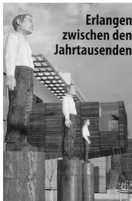
Ein Bildband als Zwischenbilanz

Besondere Akzente setzte die Gleichstellungsstelle für Frauenfragen 2005/2006 mit Schwerpunkten wie Frau und Gesundheit, mit dem Netzwerk Alleinerziehende, den Arbeitskreisen „Gegen Männergewalt an Frauen und Kindern“ und „Kinder- und familienfreundliches Erlangen“. Außerdem organisierte sie wieder das Fachforum Mädchenarbeit, Existenzgründerinnenstammtische und Diskussionsforen zum Generalthema Gender