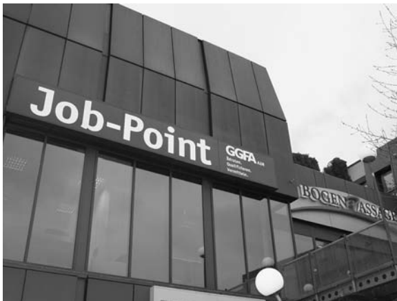
Erste Adresse für Arbeitssuchende: der Job-Point der GGFA

Die Kompetenzfelder von Wirtschaft und Wissenschaft zu stärken und die Standortvorteile unserer Stadt in den Fokus von Firmengründern und Investoren zu rücken, gehört zu den Kernaufgaben der Abteilung Wirtschaftsförderung und Arbeit. Von der Organisation des Erlanger Clusterkongresses im Rahmen der Clusteroffensive der Bayerischen Staatsregierung bis hin zur Unterstützung von Firmen bei der Ansiedlung reicht die Bandbreite ihrer Arbeit. So konnte u.a. die Firma Messner Gebäudetechnik GmbH mit 150 Mitarbeitern im Max-Elstner-Industriepark ihren neuen Standort beziehen.