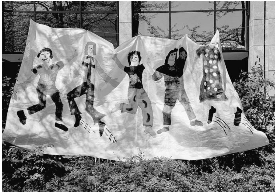
Fröhliche Werbung für das sommerliche Kinder- und Familienfest rund um den Rathausplatz