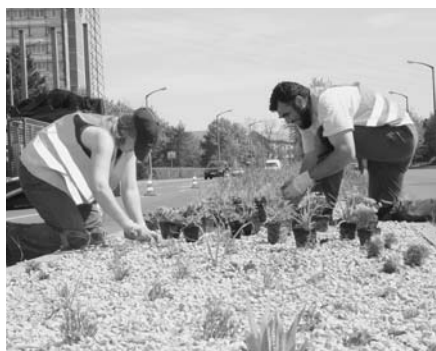
Vorarbeiten des Eigenbetriebs zum Umweltjahr 2007

Im Bereich des Katastrophenschutzes wurde im Vorfeld zur Fußballweltmeisterschaft im November 2005 im Großraum Nürnberg-Fürth-Erlangen eine große Stabsrahmenübung durchgeführt. Bald danach konnte das neue Einsatzleitfahrzeug für den Katastrophenschutz offiziell in Dienst gestellt werden.