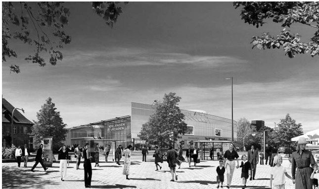
Computergrafik des Einkaufszentrums Erlangen Arcaden

Für das innerstädtische Einkaufszentrum „Erlangen Arcaden“ wurde nach Durchführung des Planungswettbewerbes, die Hochbauplanung für den ausgewählten Entwurf des Architekturbüros KJS - Erlangen fertiggestellt. Ebenso konnte der Vorhaben- und Er-