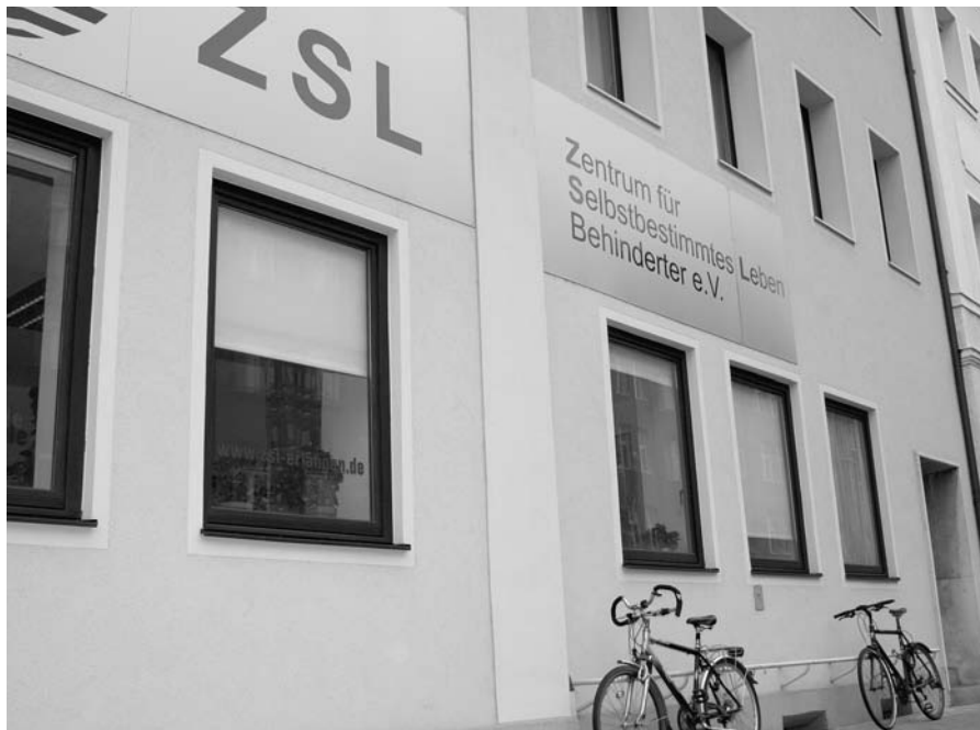
Das Zentrum für selbstbestimmtes Leben: ein wichtiger Gesprächspartner der Stadt

Waren Anfang 2005 zunächst nur ehemalige Sozialhilfeempfänger Leistungsbezieher des Arbeitslosengeldes II (1.246 Bedarfsgemeinschaften mit 2.598 Personen), so wurden bis Juli 2005 auch alle ehemaligen Arbeitslosenhilfebezieher, die ihre Leistungen vorher noch von der Arbeitsagentur erhalten hatten, in die Betreuung durch die Stadt Erlangen übernom-