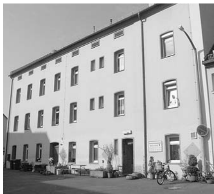
Städtisches Übernachtungsheim an der Wöhrmühle

Die Zahl der Sozialwohnungen ist in den Jahren 2005 und 2006 weiter gesunken. 2006 befanden sich noch 3.555 Wohnungen in der sozialen Bindung. Um diese Bedingungen zu verbessern, fördert die Stadt mit eigenen Mitteln den sozialen Wohnungsbau und versucht durch den Erwerb von sog. Belegungsrechten das Angebot spürbar zu vergrößern. Darüber hinaus wurde nach dem Gesetz über den Abbau der Fehlsubventionierung im Wohnungswesen eine Ausgleichsabgabe von den betroffenen Wohnungsinhabern erhoben. Die entsprechende Fehlbelegungsquote der Sozialwohnungen lag in 2006 bei 6,97% - die aus der Fehlbelegungsabgabe erzielten Einnahmen beliefen sich auf rund 88.000 Euro, die an die Regierung von Mittelfranken abzuführen waren.