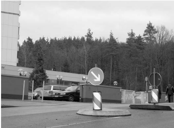
Neue Fußgängerinsel am Wohnstift Rathsberg

punkte bildeten Satzungsänderungen zur Einführung des Alkoholverbots im öffentlichen Raum und die Neuregelung der Sperrzeitverordnung auf kommunaler Ebene für die Bereiche der Alt- und Innenstadt. Einen besonderen Schwerpunkt bildeten darüber hinaus Maßnahmen im Zusammenhang mit der Vogelgrippe und der Bekämpfung des Eichenprozessionsspinners.