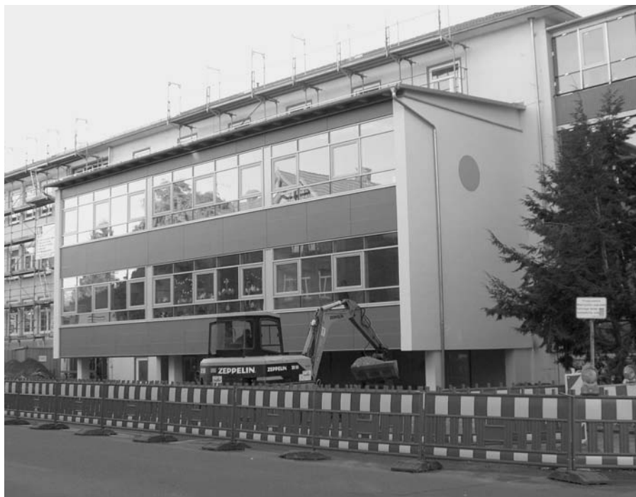
Erweiterungsbau des Marie-Therese-Gymnasiums für die G8-Nachmittagsbetreuung

Im Stadtteil Röthelheimpark wurden weitere Wohnquartiere erschlossen und bebaut. Im März 2005 ist die Entscheidung getroffen worden, dass die Franconian International School (FIS) im Röthelheimpark errichtet wird. Am 27.07.2006 wurde die Einweihung des Siemens-Trainings-Centers an der Allee am Röthelheimpark gefeiert.