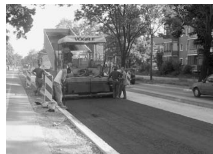
Teearbeiten in der Äußeren Brucker Straße

Umfangreiche Kanalsanierungsmaßnahmen wurden in der historischen Innenstadt durchgeführt und für die Kläranlage wurden die erforderlichen Maßnahmen für die Umrüstung in eine einstufige biologische Anlage realisiert.