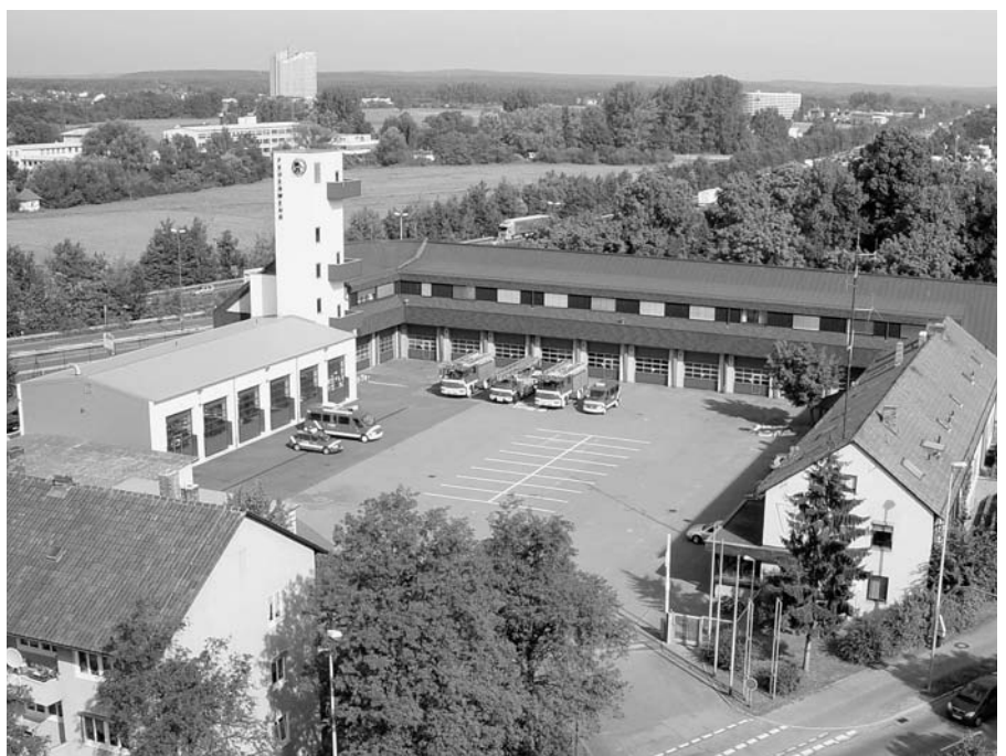
Die ständige Wache der Feuerwehr Erlangen mit der neuen Fahrzeughalle (links)

Im Jahr 2005 wurde als Kommandowagen ein erdgasbetriebener Golf Variant in Dienst gestellt.