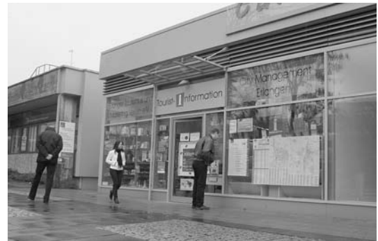
Wichtiger Anlaufpunkt für Besucher der Stadt

versicherungspflichtigen Beschäftigten einen für Erlangen historischen Höchststand.