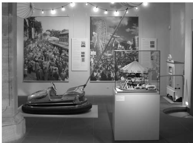
Souvenirs aus 250 Jahren Bergkirchweihgeschichte

Das Kultur- und Freizeitamt veranstaltete einen Kindertanztag, an dem rund 800 Kinder rund 4000 Besuchern ihre Lust an kultureller Bewegung zeigten. An den „Literaturlandschaften Bayerns“ beteiligte sich Erlangen mit einer „Kinder- und Jugendliteraturwoche“. Ein Highlight anderer Art war die Ausstellung des druckgrafischen Werks von Jörg Immendorf, dem offiziellen Portraitisten von Altbundeskanzler Gerhard Schröder, in der Städtischen Galerie. Das traditionell Poetenfest erhielt 2005 mit dem von der Kulturstiftung neu geschaffenen „Erlanger Literaturpreis für Poesie als Übersetzung“ zusätzliche Attraktivität und internationale Beachtung. Ebenfalls 2005 beteiligte sich Erlangen mit neuen Kontakten nach Zypern am Großraum-Projekt „EuroVisionen“, mit dem die Kultur der neuen EU-Mitglieder präsentiert wurde. Auch die Traditions-Festivals Figurentheater und Internationaler Comic-Salon lockten Tausende von Besuchern an.