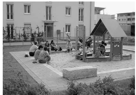
Um Spielplätze kümmert sich in Erlangen ein eigenes Spielplatzbüro

kirchweih“ lockte 2005 rund 8000 Besucher in das Haus am Martin-Luther-Platz und auch der Begleitband des Archivs fand reges Interesse. „Die Schrecken des Krieges“ vereinten erstmals die drei großen graphischen Bilderszyklen von Callot, Goya und Otto Dix mit dem Original der Kriegsfibel Brechts. 2006 würdigte das Museum den Erlanger Maler Christian Leinberger zu seinem 300. Geburtstag mit Ausstellung und Katalog. Anlässlich des 300. Gedenktages des Altstadtbrandes richtete das Museum den Blick nach vorn und thematisierte mit großem Publikumsinteresse Geschichte und Perspektiven der Altstadt. Den größten Erfolg bei Schulklassen hatte die 2006 gezeigte Wanderausstellung „Damals in der DDR“ aus