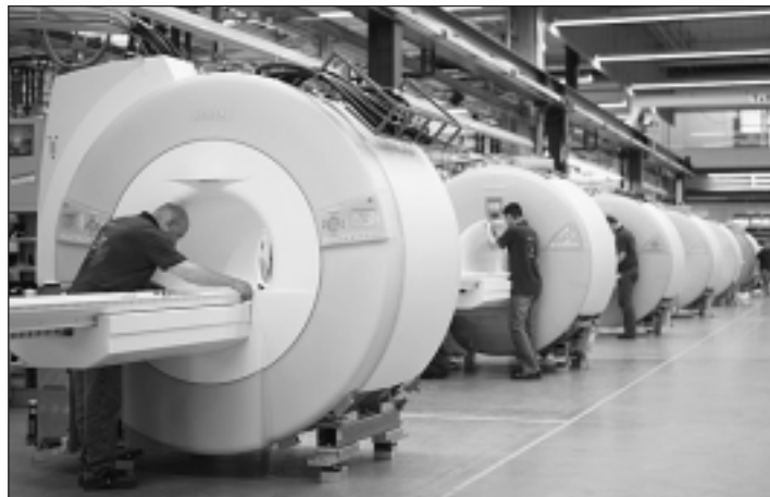
Einen Blick in die Fertigungshalle der MedFabrik.

Hugenottenstadt baut führende Position aus - Verbesserungen möglich