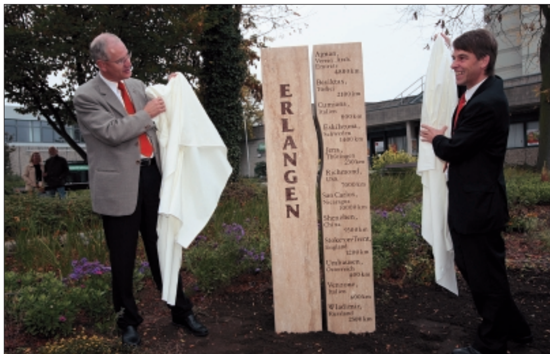
Nach der Enthüllung der Partnerschaftsstele auf dem Rathausplatz: die Oberbürgermeister von Erlangen und Jena.

300 Gäste aus Jena in Erlangen - Umfangreiches Programm am Tag der Deutschen Einheit