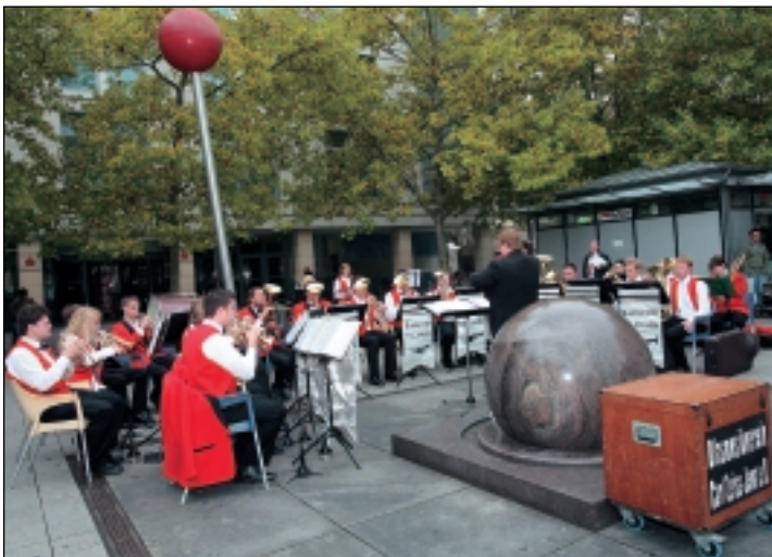
Sorgen für gute Stimmung auf dem „Hugo“: der Blasmusikverein Carl Zeiss Jena