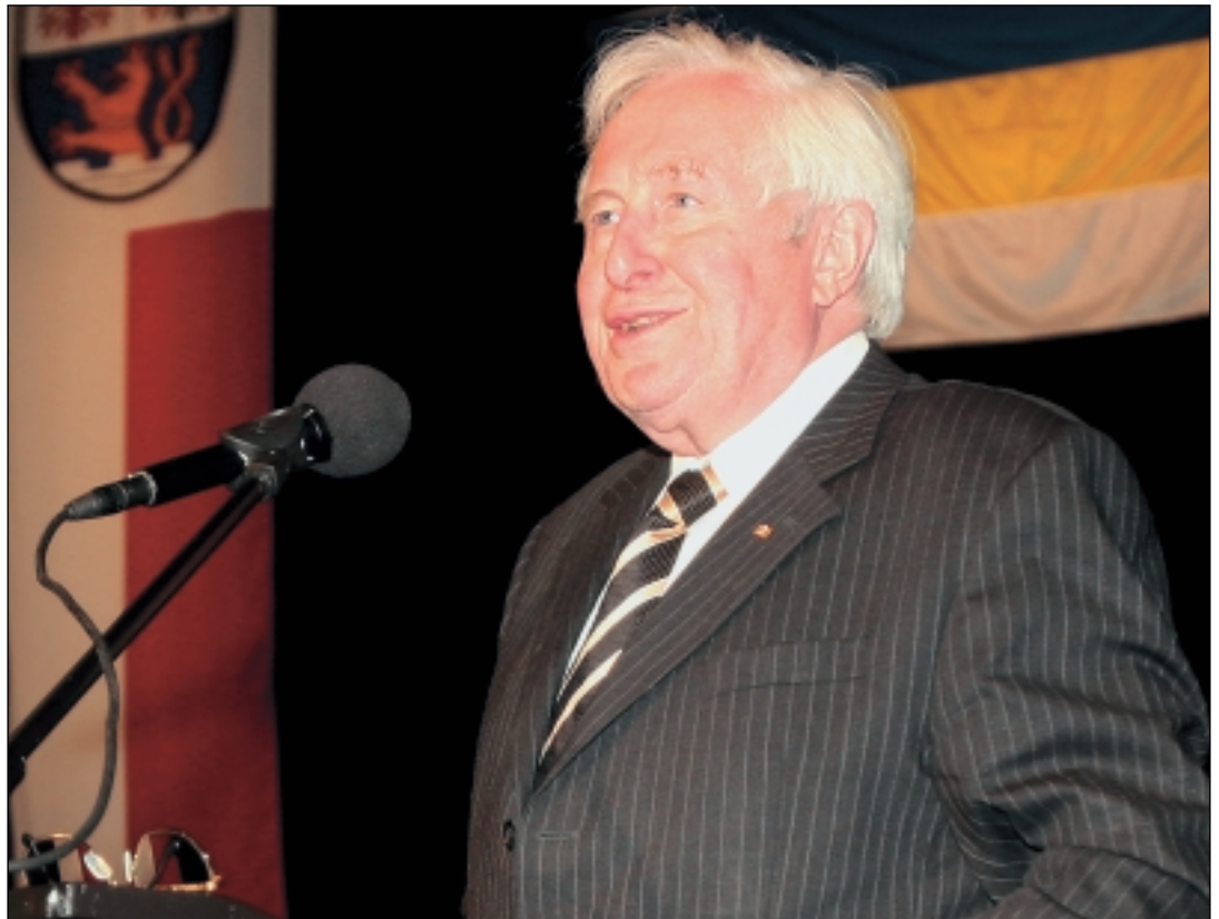
Engagierter Festredner: Prof. Bernhard Vogel bei seiner Festansprache im vollbesetzten Erlanger Markgrafentheater.