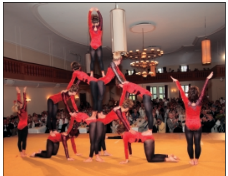
Akrobatische Einlage: die „Zaubervögel“ aus Eckenhaid im Redoutensaal

Um 15.00 Uhr nahm die Jugend das Heft in die Hand. Ein Dutzend Schüler