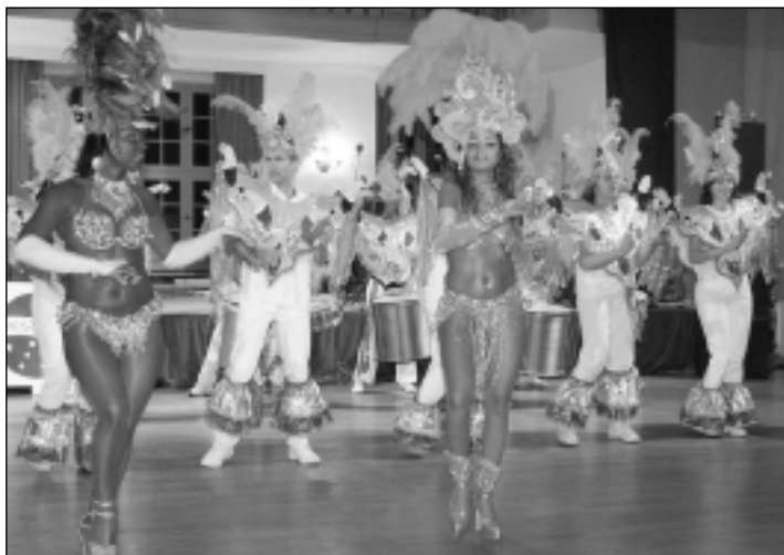
Der beliebte Pre-Carnavalesco-Abend des deutsch-brasilianischen Kreises findet dieses Jahr am 18. Oktober im Redoutensaal statt.

Vom 27. September bis zum 26. Oktober 2008 findet der 22. Interkulturelle Monat statt. Unter dem Leitspruch „Menschen und Kulturen in Erlangen“ präsentieren die Veranstalter kulturelle und kulinarische Highlights: Chinesisch-Schnupperkurse, Orientalische Tanzshows, internationale Feste, Vorträge und vieles mehr laden zum Besuch ein, besonders Familien und Kinder werden auf ihre Kosten kommen. Höhepunkt des Veranstaltungsreigen ist das interaktive Theaterstück „Culture Clash“, das von Jugendlichen einstudiert wurde, sich mit Integration und Migration auseinandersetzt und am 1. Oktober aufgeführt wird. Im Anschluss an die Vorführung wird der „Diogo-Pereira-Preis für Menschen, die handeln“ verliehen. Eröffnet wird