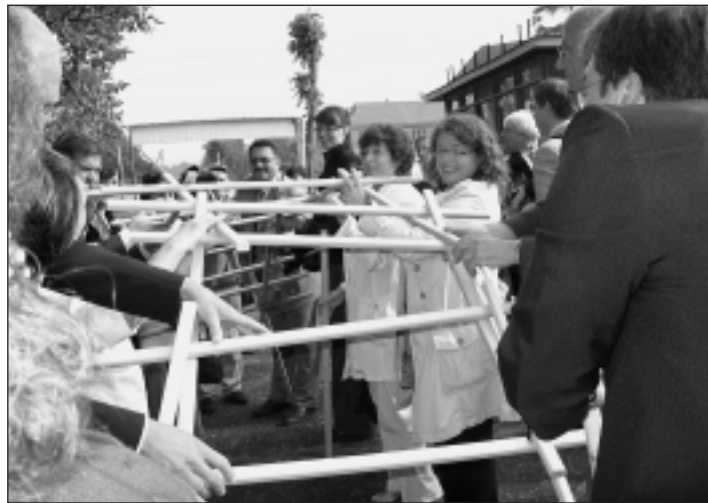
Nicht nur symbolisch: Eine deutsch-russische Brücke wird von den offiziellen Gästen gemeinsam gebaut.

20-köpfige Delegation bei Eröffnung eines Rehabilitationszentrums für psychisch kranke Kinder