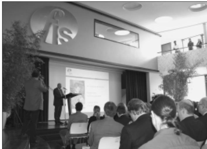
Die voll besetzte Aula der FIS bei der Ansprache von Ministerpräsident Günther Beckstein.

Franconian International School durch Ministerpräsident Beckstein eingeweiht