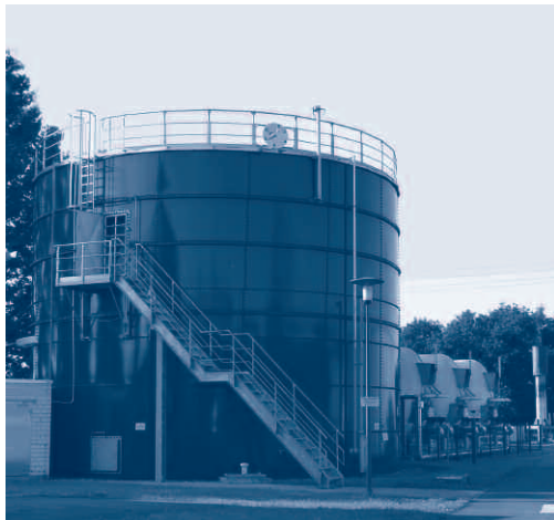
Gasspeicheranlage. Im Vordergrund der Niederdruckgasspeicher; im Hintergrund drei Mitteldruckgasspeicher (liegend)

50er Jahre gelangten nach wie vor Abwässer ungeklärt in die Regnitz. Ab 1951 verbesserte sich die Situation aufgrund kleinerer Behelfskläranlagen in den einzelnen Stadtteilen etwas. Im Jahr 1957 wurde dann die Erlanger Zentralkläranlage am heutigen Standort realisiert. In den 60er und 70er Jahren gelang es durch den Bau von neuen Kanälen nicht nur, alle Erlanger Stadtteile sukzessiv an die Kläranlage anzuschließen, auch zahlreiche Umlandgemeinden entschieden sich dafür, nach Erlangen zu entwässern. Bereits in den Jahren 1963 bis 1978 war die erste Erweiterung des Klärwerks erforderlich. Diese bestand aus dem Bau der zweiten biologischen Reinigungsstufe, eines weiteren Faulturms und zweier Tropfkörper sowie der Schlammwässerung. Weitere Maßnahmen und Erweiterungen folgten und dauern bis heute an: Zur Zeit wird das Klärwerk von einer mechanisch-zweistufig-biologischen Anlage zu einer einstufig-biologischen Anlage umgebaut. Die Baumaßnahmen wurden im Herbst 2005 mit dem Abbruch der Tropfkörper begonnen. Seit 2006 werden neue Nitrifikationsbecken gebaut. Ab September 2007 wird das bestehende Belebungsbecken für die Denitrifikation umgebaut und die maschinen- und elektrotechnische Ausrüstung erneuert und ergänzt.