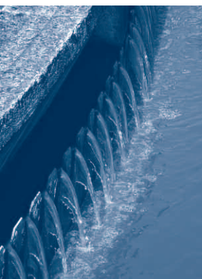
Zahnschwelle der Vorklärbeckenstufe, Baujahr 1957

Für CSB, \text{BSB}_5 und \text{P}_{\text{ges}} kann durchgängig ein sehr guter Abbau der Schmutzfracht erzielt werden. Auch für \text{NH}_4\text{-N} ergibt sich für die letzten beiden Jahre ein Wirkungsgrad von über 99%. Einzig beim \text{N}_{\text{ges}} ist eine tendenzielle Verschlechterung zu erkennen, die allerdings auf die zur Zeit laufenden Umbaumaßnahmen (Abriss der Tropfkörper) zurückzuführen ist. Gleichwohl kann auch beim \text{N}_{\text{ges}} der gesetzlich vorgeschriebene Grenzwert eingehalten werden. Insgesamt betrug die auf der Kläranlage Erlangen zu behandelnde Abwassermenge 18.856.000 \text{m}^3/\text{a} im Jahr 2004, 17.692.000 \text{m}^3/\text{a} im Jahr 2005 und 16.844.000 \text{m}^3/\text{a} im Jahr 2006.