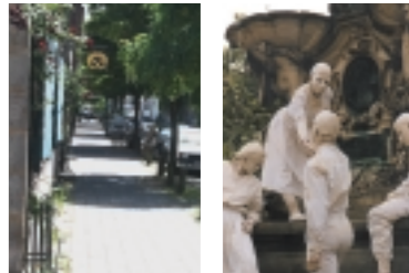
Idyllischer Winkel – Altstädter Kirchenplatz

FigurentheaterFestival, Internationale Literaturtage) auf sich aufmerksam. Ihre ökologieorientierte Kommunalpolitik (Schwerpunkte: massive Förderung des Fahrradfahrens sowie des Öffentlichen Personennahverkehrs, Arten- und Biotopschutz, nachhaltige Grünplanung) beschert ihr zahlreiche (internationale) Auszeichnungen, u.a. die Aufnahme in die UNO-Weltrangliste Global 500 sowie 1990 und 1991 den Titel „Bundeshauptstadt für Natur- und Umweltschutz“.