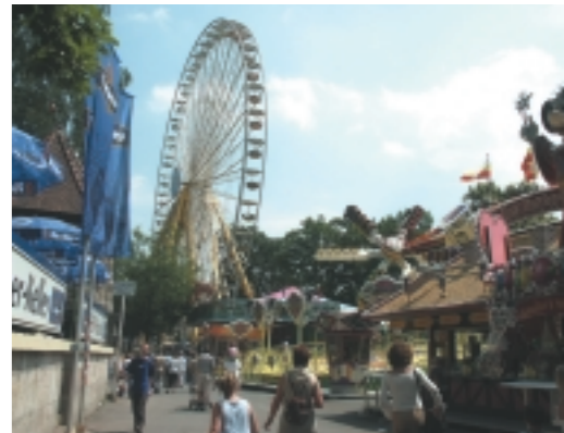
Ein Wahrzeichen der Bergkirchweih – das Riesenrad

Seit 1996 spielt Erlangen im europäischen Wettbewerb der Regionen eine neue Trumpfkarte aus, das „ Medical Valley “. In Anlehnung an den Namen Silicon Valley steht der Begriff für medizintechnisches, pharmazeutisches und ärztlich-wissenschaftliches Know-how, das in dieser Kombination in Deutschland seinesgleichen sucht. Diese herausragende Kompetenz will auch das Jahresmotto 2005 „Gesundheit erleben, Gesundheit ERLANGEN“ verdeutlichen. Vorrangiges Ziel der damit verbundenen Veranstaltungsreihe