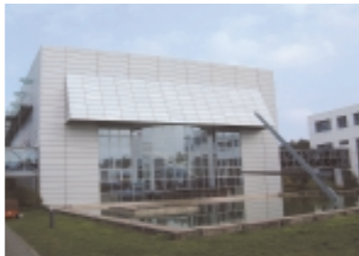
Modernes Forschungslabor der FAU