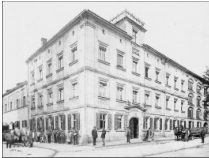
Erichbräu am Altstädter Kirchenplatz um 1873, heute Sitz von Dreycedern e.V. Foto: „Ein Erlanger bitte“

Stadt gewährt am 13. September Blicke hinter sonst geschlossene Kulissen