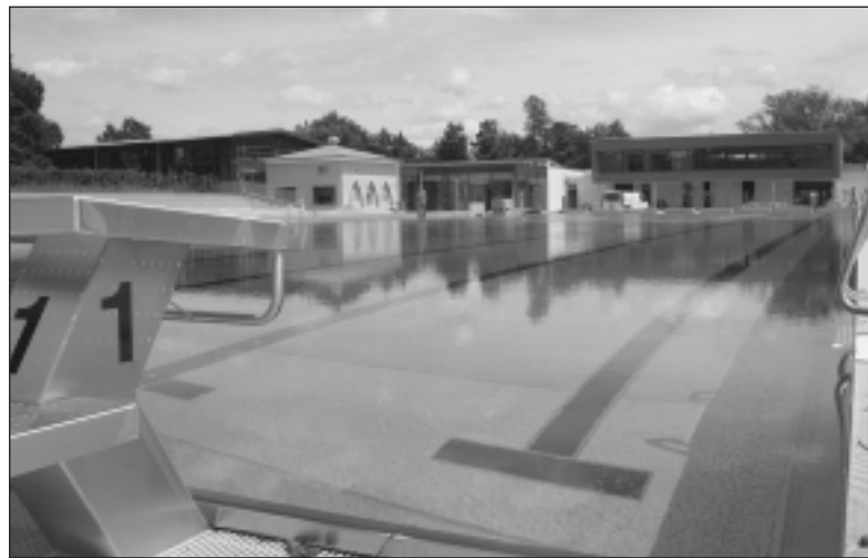
Garantiert nassen Spass im neuen Ambiente: Das sanierte Röthelheimbad.

Freier Eintritt am 19./20. Juni – zwölfmonatige Umbauphase – neuer Haupteingang