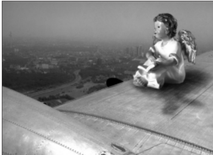
Wenn Engel fliegen, haben sie offenbar auch manchmal ein Buch dabei.

Die Stadtbibliothek Erlangen im Bürgerpalais Stutterheim (Marktplatz 1) zeigt noch bis 11. Januar eine Ausstellung mit Fotos von Rainer Griese: überraschende Ansichten und Montagen, die zum Schmunzeln einla-