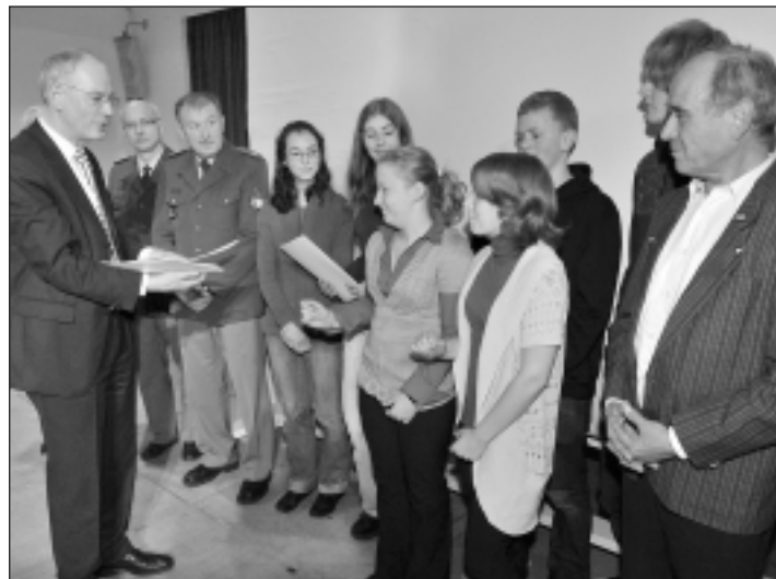
Im Beisein von Polizei und Verkehrswacht erhielten die „Lotsen“ ihre Urkunden.

Stadt sagt „Dank!“ - 30.000 Akteure in Vereinen und Verbänden aktiv