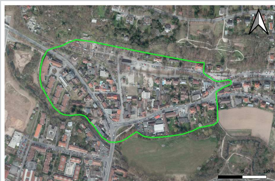
Räumlicher Umgriff Bewohnerparkgebiet "An den Kellern"