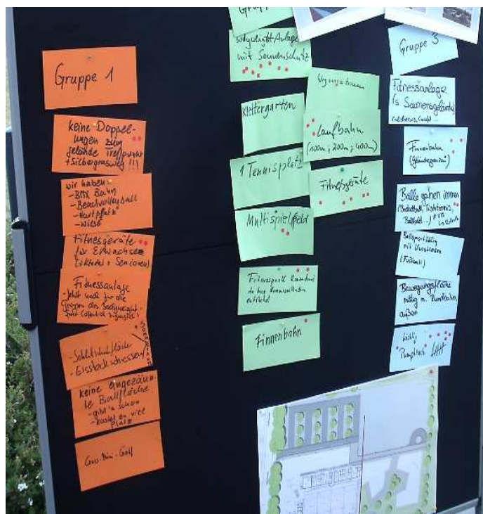
Abbildung 2 "Ideensammlung - Aktivität, Sport und Fitness"