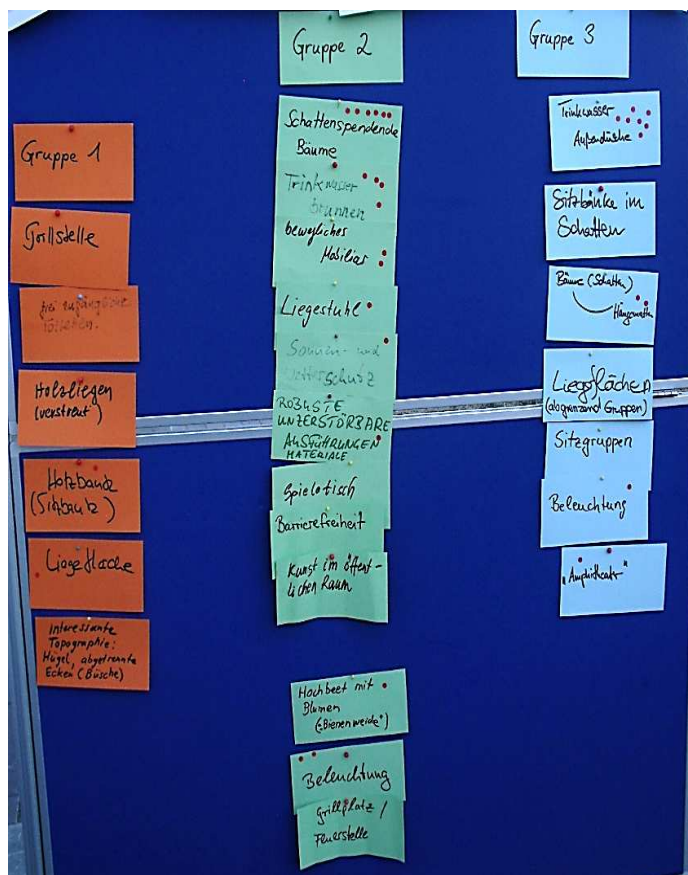
Abbildung 3 "Ideensammlung - Begegnung, Kommunikation und Verweilen"