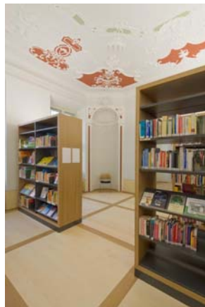
Abb. 14: Neue Regale, funktional und gestalterisch ansprechend. © G. Hagen

Die Raumseite kann folglich in voller Tiefe für die Bücherregale genutzt werden. Da alle Räume unterschiedliche Bautiefen haben und die zur Verfügung stehende Raumtiefe maximal genutzt werden sollte, kommen hier nicht die üblichen Stahlstandardregale zur Ausführung. Passend zu den Eicheböden wurden eigens hierfür Regale mit einem ‚Eichebilderrahmen‘ entworfen, eingerahmt und multifunktional in sich zurücknehmendem Anthrazit, höhenverstellbar für Bücher, DVDs, CDs, Präsentationen.