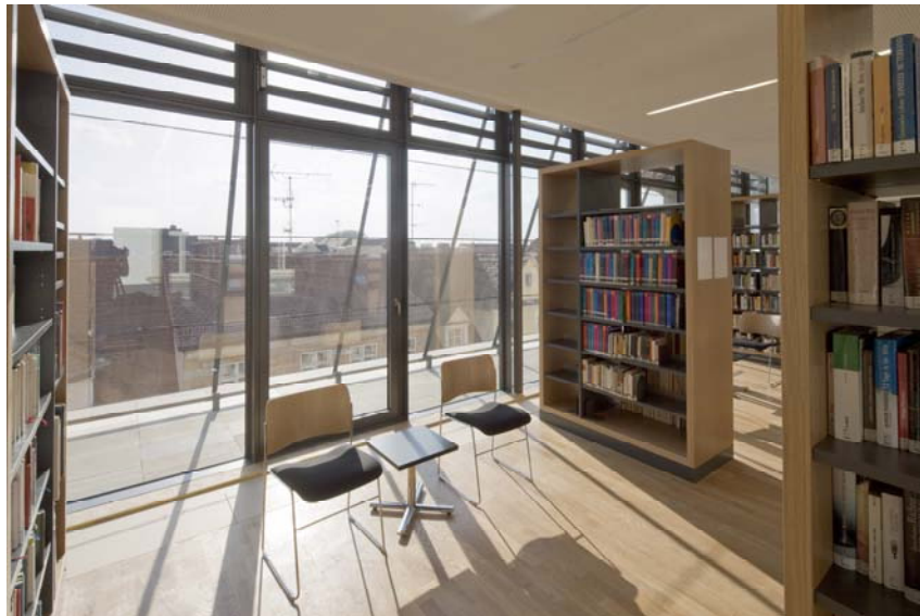
Abb. 19: Aufgestockt: das Erlebnis der abendlichen Westsonne – gerade der richtige Platz für die Belletristik.