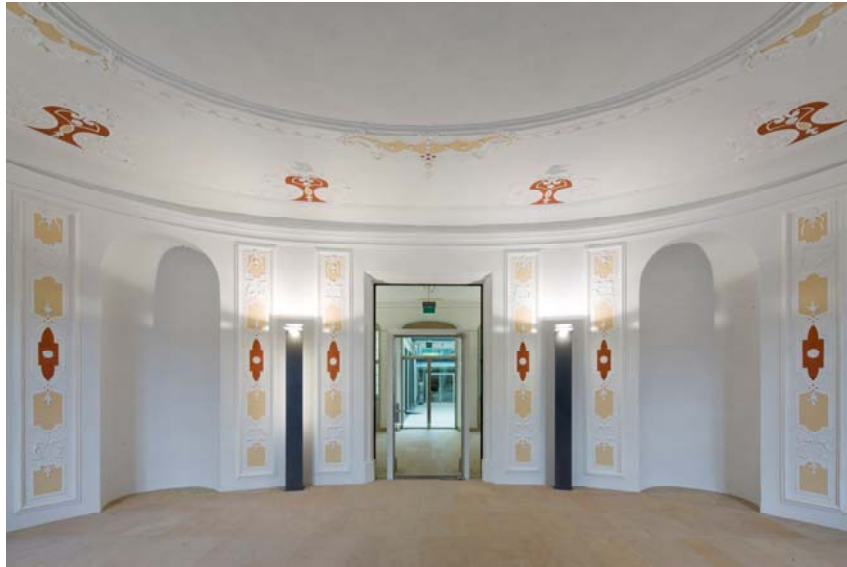
Abb. 8: Der neugestaltete Eingang des Palais.

Glücklicherweise interessierte sich der Stadtrat Erlangens sehr für sein Juwel, und so konnten wir in mehreren Bauführungen Fortschritt und Problemstellungen zeitnah erläutern und Entscheidungen herbeiführen.