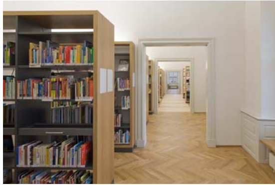
Abb. 13: Die Kapazität der Bibliothek scheint endlos.

Die Enfilade zieht sich an der ersten Fensterachse der Außenwand entlang, sodass am Fenster Leseplätze mit Tageslicht angeordnet werden konnten; in der Fensterlambris befindet sich, versteckt und nachrüstbar, die gesamte EDV- und elektrotechnische Installation; an den Leseplätzen befinden sich Leuchten und alle notwendigen Stromversorgungen.