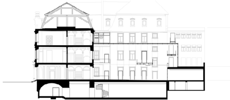
Abb. 6: Der Längsschnitt zeigt die überarbeiteten Keller und die neue Innenhofüberdachung. © Architekten BDA Dipl.-Ing. Grellmann Kriebel Teichmann.

Im September 2007 zogen alle Einrichtungen des Fünf-Häuser-Blocks Palais, Post, Polizei, Einhornstraße 6 und Hauptstraße 27 aus und die Bücherei zwischenzeitlich in ein leerstehendes Kaufhaus um. Der „Tag des offenen Denkmals 2007“ zeigte den Bürgern Erlangens ein leergeräumtes Haus. Ohne die Bücherei-Einrichtung wird der Blick schonungslos frei auf den Architektur-Mix des letzten Jahrhunderts und die Wunden im Baudenkmal.