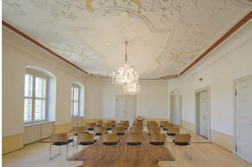
Abb. 16: Der multifunktional zu nutzende Bürgersaal.

Treppenhaus wurden auf die nach dem Brand von 1921 aufgebrachte ‚neue‘ Stuckdecke übertragen, so entsteht eine harmonische Einheit dieser hochwertigen Räume. Das Mittelfeld des historischen Bodens mit seinen Eichefriesen ist noch erhalten, während im Übrigen die Böden im Stuckbereich mit den Harthölzern Eiche und Ahorn ergänzt wurden, um der hohen Beanspruchung gerecht zu werden. Mit Kronleuchter und Klimatrüben ausgestattet wird der Bürgersaal seiner multifunktionalen Bestimmung gerecht.