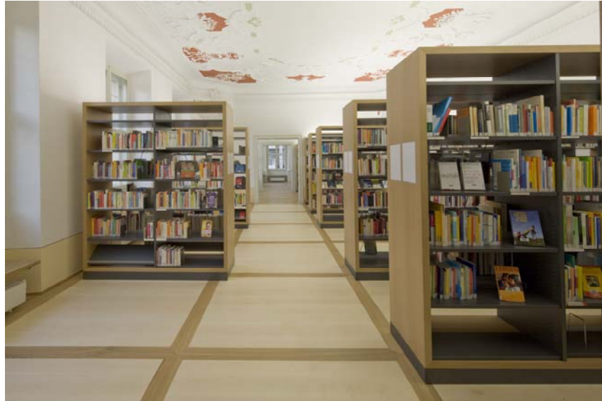
Abb. 15: Die in die Regale integrierte Raumbeleuchtung schont das historische Gemäuer.

Auf den hohen Regalen kann alles ‚versteckt‘ werden, was an technisch Notwendigem in die historischen Raumschalen zu integrieren ist: Notrufanlage, Brandmelder, ELT-Klemmstellen, Notbeleuchtung und letztendlich die Raumbeleuchtung, da die historischen Decken ‚tabu‘ sind – und das ist auch gut so.