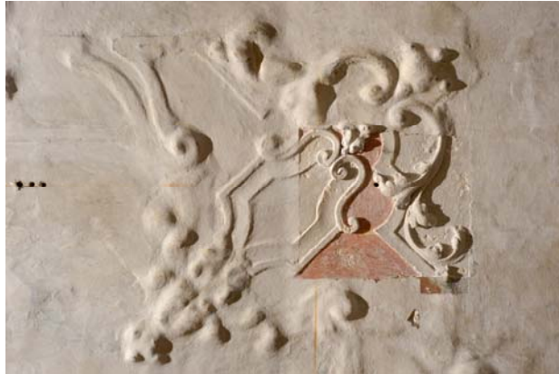
Abb. 4: Unter mehreren Schichten verbirgt sich der Stuck.

Beim Rundgang durch das Gebäude entdeckten wir das ‚verborgene Juwel‘: Unter 20 bis 30 Malschichten verborgene Stuckdecken, altes Tafelparkett unter PVC-Böden, gründerzeitliche Schablonenmalerei unter abgehängten Decken, fast zur Unkenntlichkeit sicherheitstechnisch modernisierte Treppenhäuser aus Gründerzeit und Barock sowie eingefügte Zwischenbauten aus den 1960er Jahren, die vor unserem geistigen Auge schon wieder abgebrochen wurden.