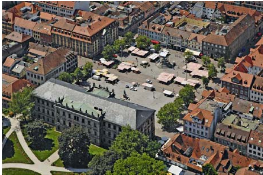
Abb. 5: Der Marktplatz aus der Vogelperspektive: das Schloss im Vordergrund, das Palais Stutterheim und die Alte Post im Bild links oben.

In den Jahren 2006 und 2007 galt es nun zunächst, die oben genannten Planungsbeteiligten ‚unter einen Hut‘ zu bekommen. Der Streit um die Quadratmeter fand erst mit dem Bauantrag 2007 ein Ende.