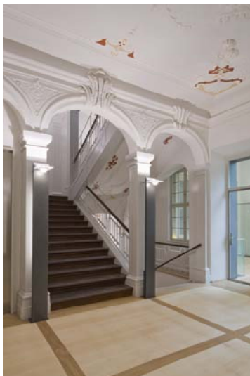
Abb. 11: Das originalgetreu restaurierte Barocktreppenhaus.