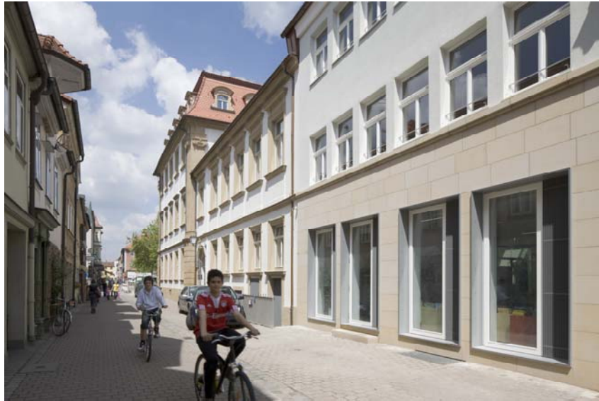
Abb. 2: Blick aus der Einhornstraße auf die westliche Front des Hauses.

Die Erlanger Bürgerschaft hat es von Anfang an in Besitz genommen: Seit der Eröffnung am 2. Juni 2010 ist es lebendiger Mittelpunkt der Stadt. Es beherbergt neben der Stadtbibliothek, wie sie nun heißt, weiterhin die Städtische Galerie, genannt Kunstpalais, und ein Café.