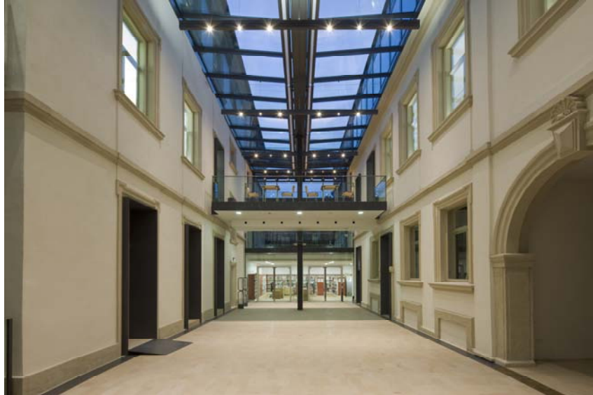
Abb. 9: Der neue Innenhof ist offen und einladend.

erlebt der Besucher auf den ersten Blick die leuchtenden Farben des barocken Vestibüls. Links geht der Blick in die Galerie, rechts zur Bibliothek, geradeaus in das Foyer des nun wieder offenen Haupttreppenhauses. Von hier aus leitet der Sandsteinboden hinauf in die Bibliothek, geradeaus in den zentralen Lesehof und zur Galerie. Durch drei zeitgenössische Glasportale ist die Ausleihverbuchung leicht zu erkennen, ohne dass sie, wie früher, im Durchzug liegen muss.