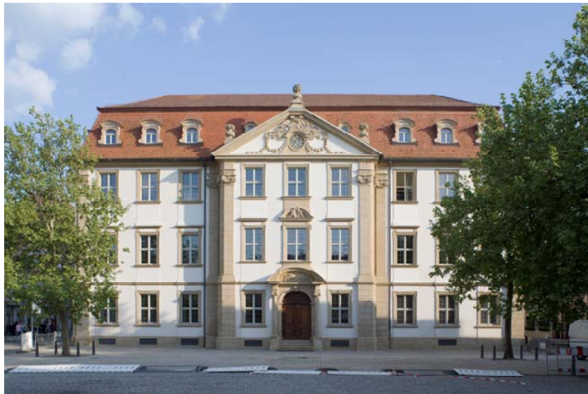
Abb. 1: Außenansicht des BürgerPalais.

Das Jahr 1971 markiert die Wende zur heutigen Nutzung. Ein neues und modernes Rathaus war in Erlangen bezugsfertig geworden – so war das Stutterheim'sche Palais frei für die Stadtbücherei. Weitere Nutzer waren die Städtische Galerie, die Galerie des Kunstvereins sowie der Heimat- und Geschichtsverein.