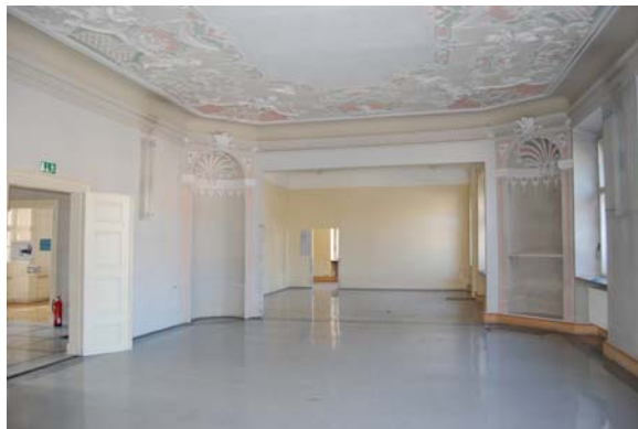
Abb. 7: Das Palais als Zeuge des letzten Jahrhunderts. © Architekten BDA Dipl.-Ing. Grellmann Kriebel Teichmann.

Im September 2007 zogen alle Einrichtungen des Fünf-Häuser-Blocks Palais, Post, Polizei, Einhornstraße 6 und Hauptstraße 27 aus und die Bücherei zwischenzeitlich in ein leerstehendes Kaufhaus um. Der „Tag des offenen Denkmals 2007“ zeigte den Bürgern Erlangens ein leergeräumtes Haus. Ohne die Bücherei-Einrichtung wird der Blick schonungslos frei auf den Architektur-Mix des letzten Jahrhunderts und die Wunden im Baudenkmal.