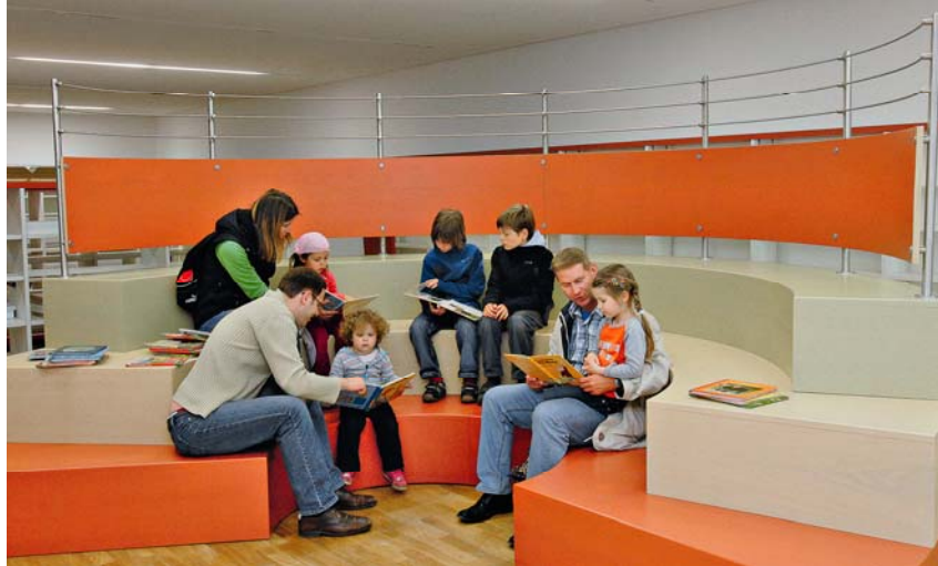
Abb. 10: Kinder und Eltern fühlen sich wohl im Palais.

Die transparente Überspannung, der Sonnenschutz und die Klimatisierung erlauben die Nutzung des Innenhofes für die unterschiedlichsten kulturellen Zwecke auch bei Schlechtwetter und im Winter. Im Süden grüßt der Campanile der Hugenottenkirche, das Eiscafé ist bewirtschaftet, und ebenerdig ist die Kinder- und Jugendbibliothek mit ihrem Freilichthof erreichbar.