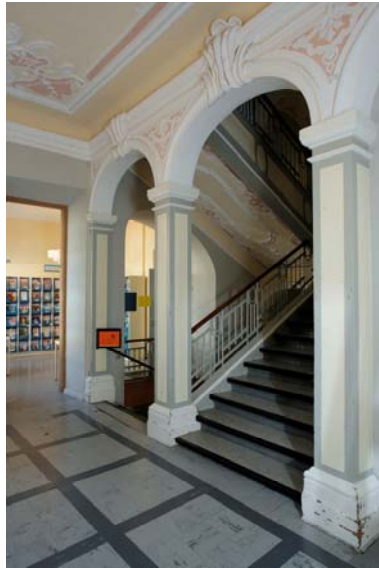
Abb. 3: Das barocke Treppenhaus birgt wahre Schätze.